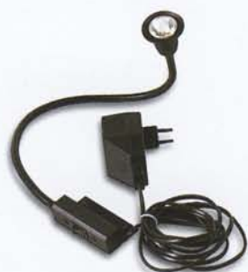
Lampada flessibile alogena Flexible halogen lamp Lámpara halógena flexible