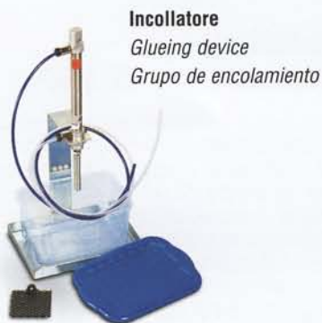
Incollatore Glueing device Grupo de encolamiento