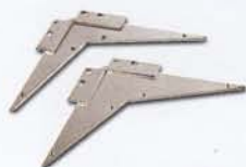
Riduzioni squadra esagono/ottagono Hexagon/octagon fence Adaptadores escuadra para hexágono y octágono