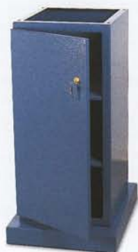
Banco armadio con ripiani e chiave Closet stand with shelves, lockable Banco armario con estantes y cerradura