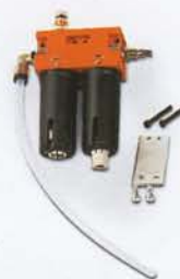
Filtro lubrificatore Filter lubricator device Grupo filtro-lubricador