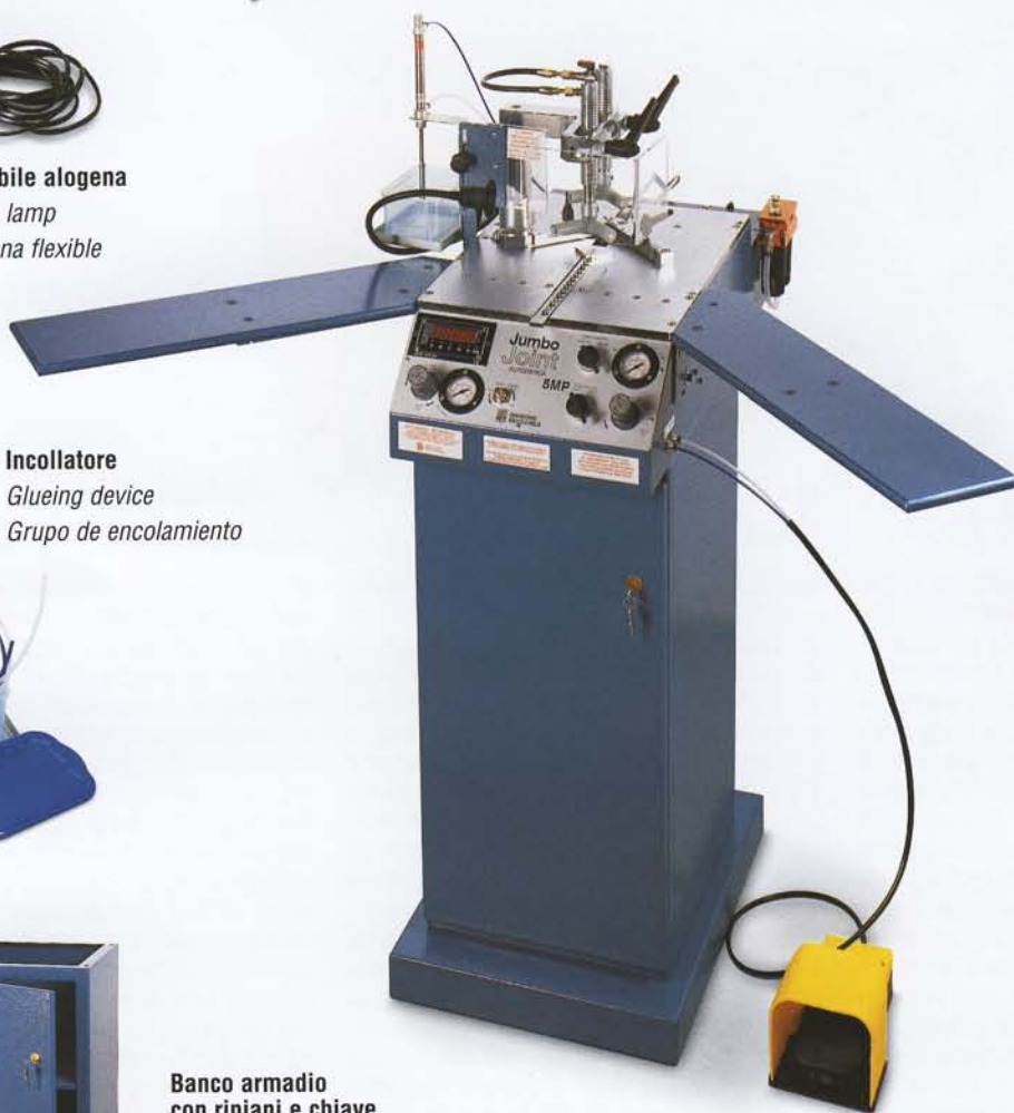
Ampliamento piano di lavoro Table for working area widening Ampliación plano de trabajo