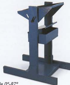
Banco inclinabile 0°-87° Tilting stand 0°-87° Soporte a inclinación variable 0°-87°